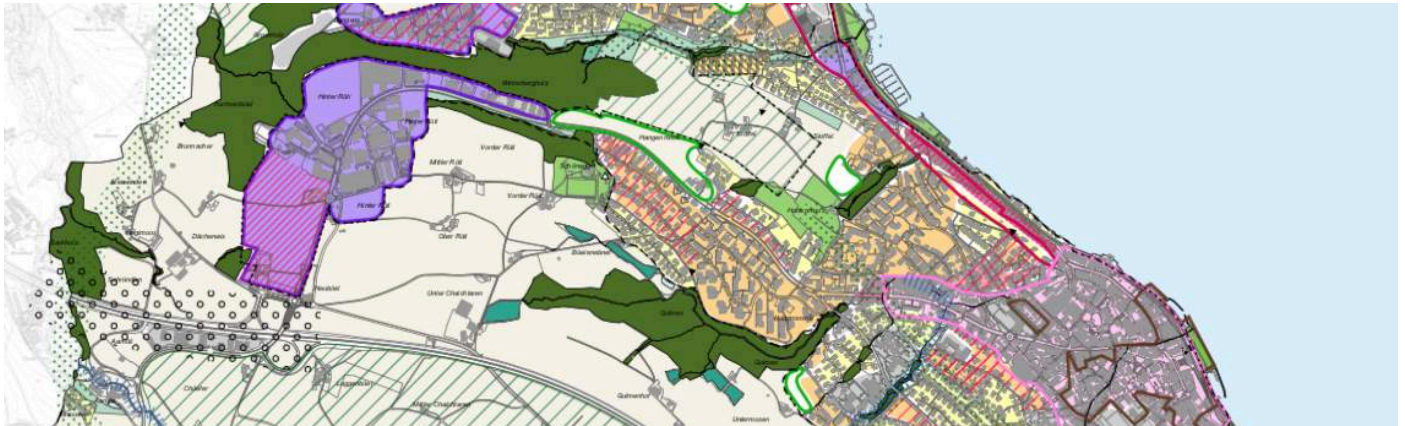
Ausschnitt Teilrichtplan Siedlung und Landschaft, Quelle: PLANAR