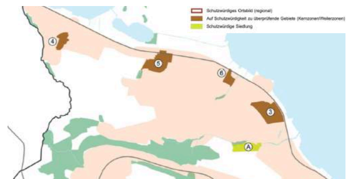
Ausschnitt Th.k. schutzwürdige Ortsbilder und Siedlungen